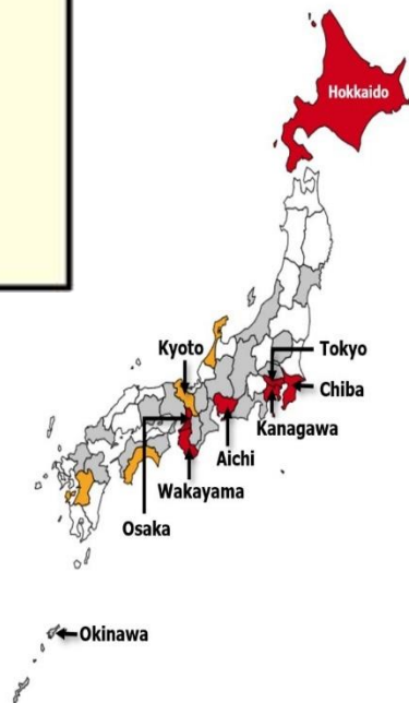
ภาพที่ 1 รายชื่อเมืองประเทศญี่ปุ่นที่ควรหลีกเลี่ยงการเข้าไปในสถานที่คนแออัด

ฝรั่งเศส เดนมาร์ก สเปน เนเธอร์แลนด์ อเมริกา สวีเดน สวีเซอร์แลนด์ อังกฤษ นอร์เวย์ เยอรมนี ญี่ปุ่น (ดูรายชื่อเมือง)