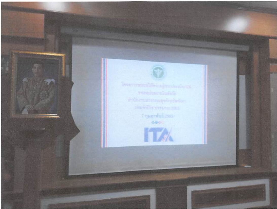
ภาพถ่ายโครงการอบรมให้ความรู้การประเมิน ITA ของหน่วยงานในสังกัดสำนักงานสาธารณสุขจังหวัดพังงา ประจำปีงบประมาณ ๒๕๖๓