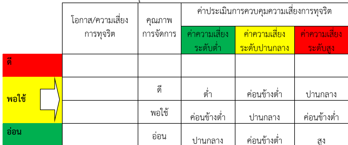
ตารางที่ ๔ ตารางแสดงการประเมินการควบคุมความเสี่ยง

อ่อน จัดการไม่ได้ หรือได้เพียงส่วนน้อย การจัดการเพิ่มเกิดจากรายจ่าย มีผลกระทบ ถึงผู้ใช้บริการ/ผู้รับมอบผลงาน และยอมรับไม่ได้ ไม่มีความเข้าใจ