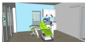
ห้องตรวจ