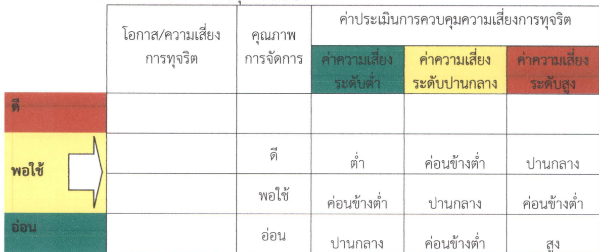
ตารางที่ ๔ ตารางแสดงการประเมินการควบคุมความเสี่ยง