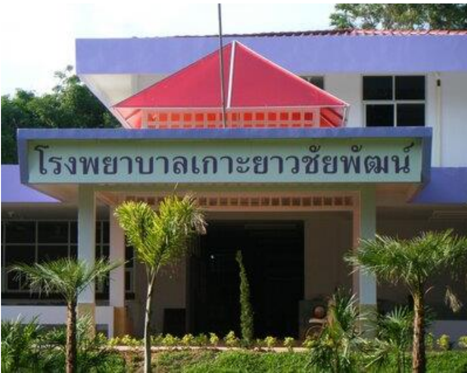
สสอ.เกาะยาว