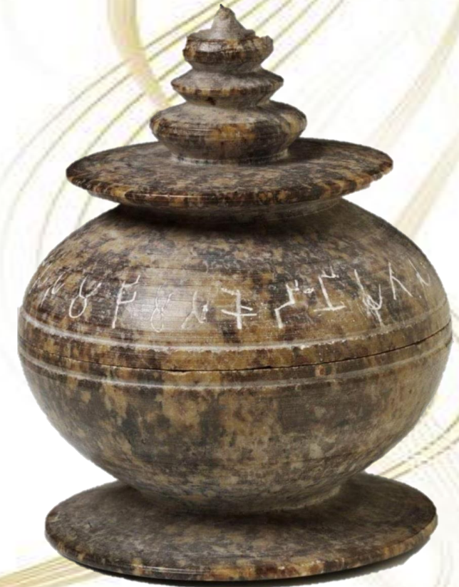
ผอบ สำหรับใส่พระบรมสารีริกธาตุ

ณ วัดประชุมโยธี (พระอารามหลวง) ตำบลท้ายช้าง อำเภอเมือง จังหวัดพังงา