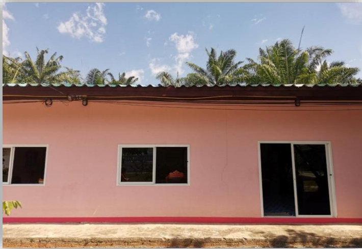
อาคารคิลาณุปัฏฐาก